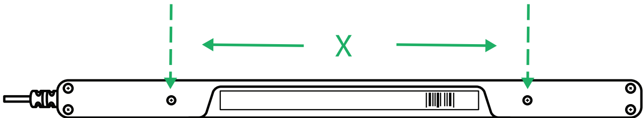
Kuva 4.1 C-C -etäisyys M3-ruuvien välillä

PCEye 5 pysyvää kiinnitystä varten on olemassa (2) M3 -ruuvia PCEye 5 selkäpuolella. C—C etäisyys (merkittynä X:llä) kohdassa Kuva 4.1 C-C -etäisyys M3-ruuvien välillä, sivu 9 on 155 mm/6,10 tuumaa. PCEye 5 on vastaava GA EyeGaze-kannattimen kanssa Rehadapt GmbH:lta.