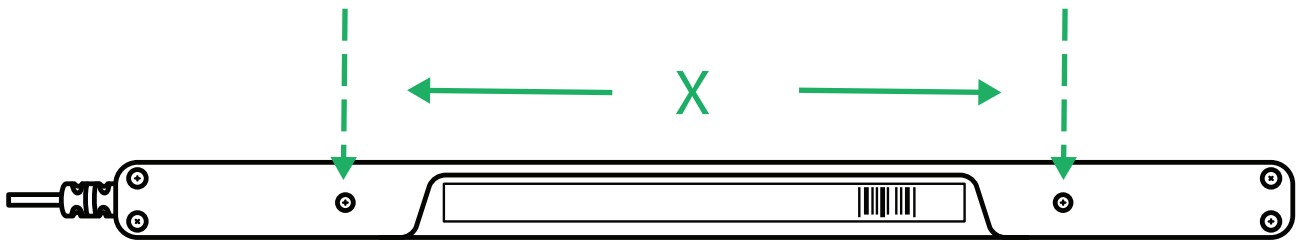
Figura 4.1 Distancia de centro a centro entre los tornillos M3

Hay dos (2) tornillos M3 en la parte posterior del PCEye 5 que sirven para fijar el PCEye 5 de manera permanente. La distancia de centro a centro (marcada con una X) en Figura 4.1 Distancia de centro a centro entre los tornillos M3, página 9 es de 155 mm/6.10 in. El PCEye 5 es compatible con el soporte EyeGaz-Bracket GA de Rehadapt GmbH.