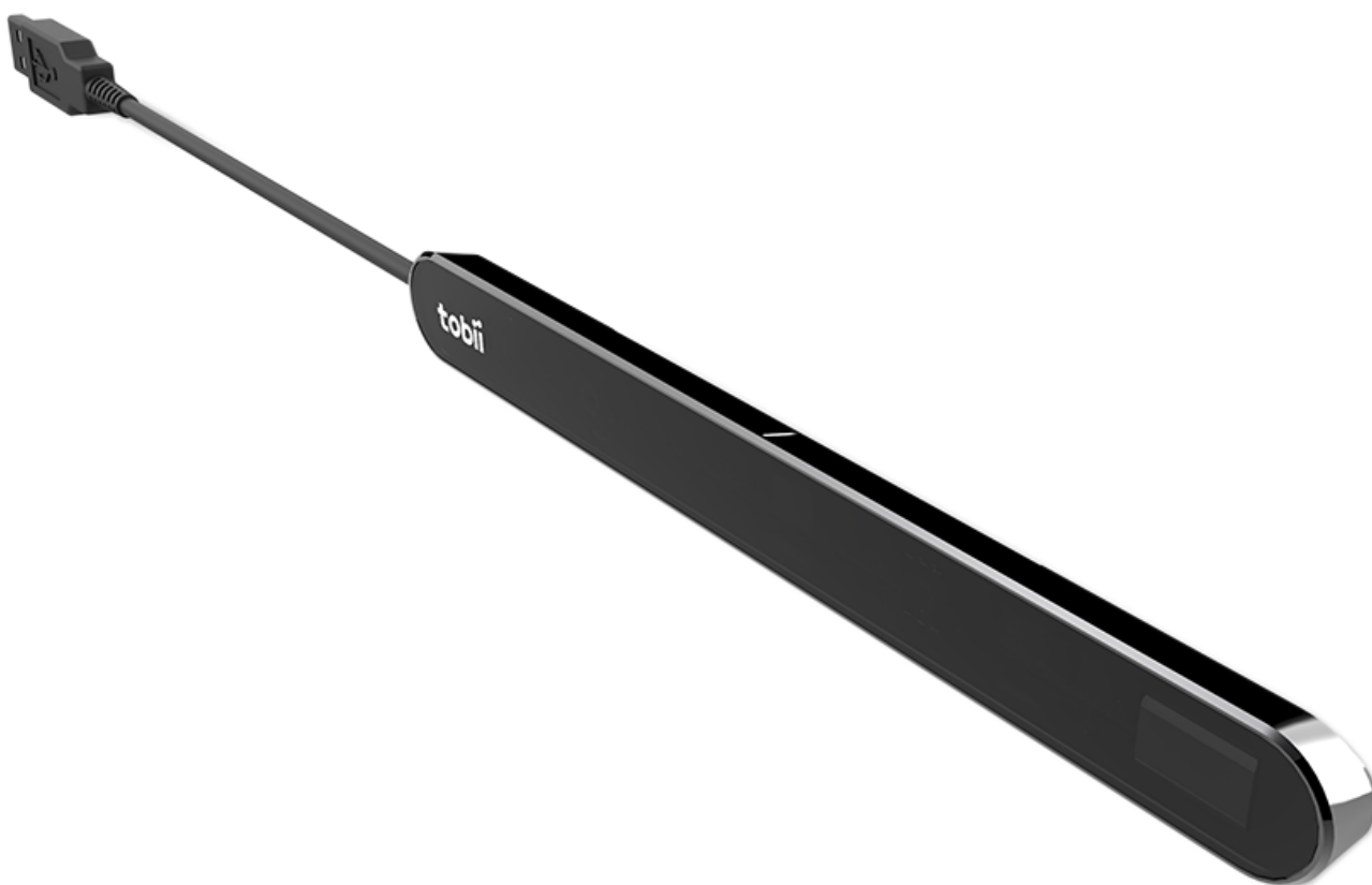
Εικόνα 1.1 PCEye Mini

Για περισσότερες πληροφορίες για τα μεγέθη της οθόνης, δείτε το Παράρτημα C Τεχνικές προδιαγραφές.